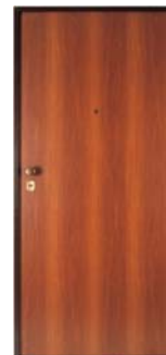
p1a lisa - 1k