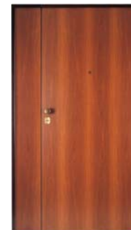
p1a lisa - 2k